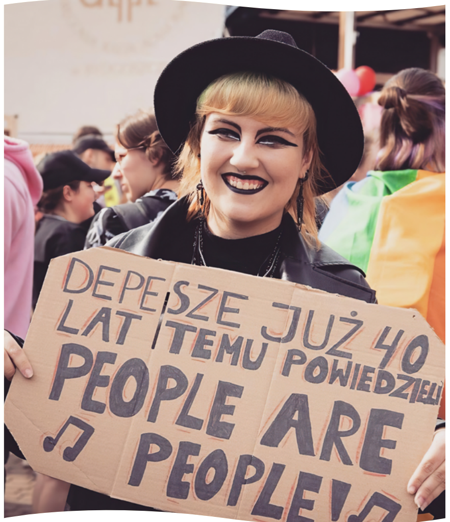
Stöd gavs till att anordna ett Pridefirande i polska Bydgoszcz.

ner att självständigt arbeta för rättigheter och bättre livsvillkor oavsett vad beslutsfattare bestämmer eller vad offentliga bidragsgivare prioriterar. RFSL gör det möjligt att bidra till arbetet för hbtqi-personers rättigheter på ett enkelt sätt. En del av RFSL:s arbete skulle inte kunna genomföras utan detta stöd från privatpersoner, organisationer och företag.