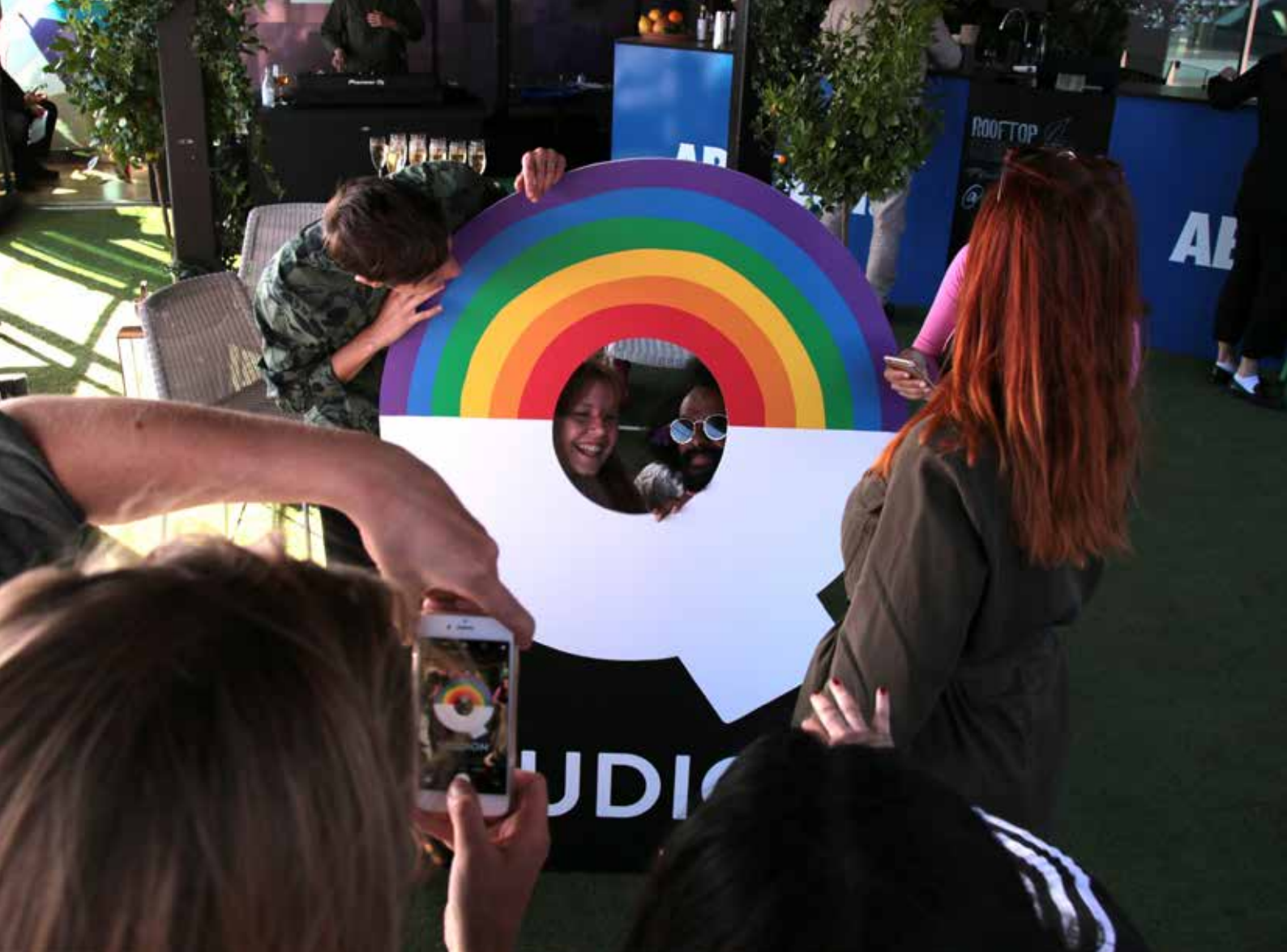
Fotografering i Q-studion innan inspelning.