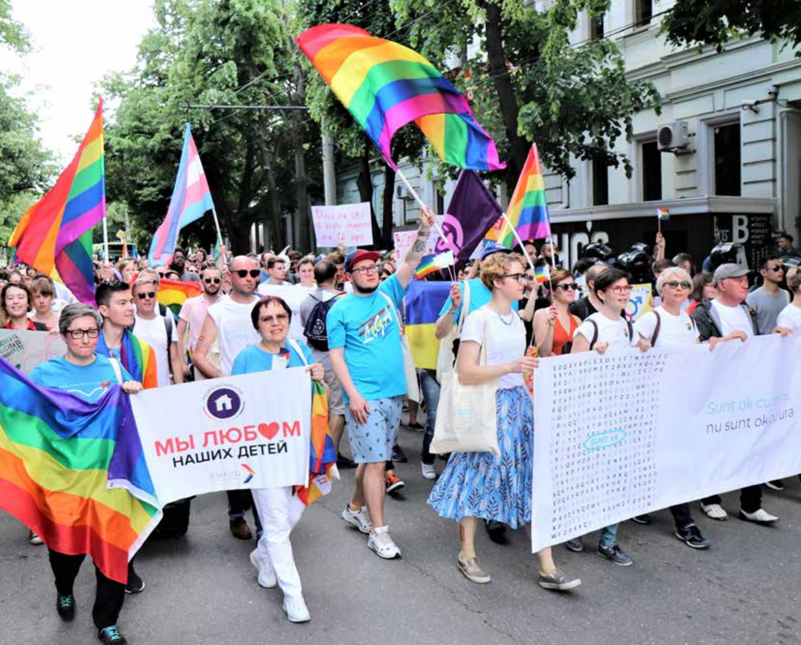
Prideparad i Chisinau, Moldavien, sommaren 2019.

relsen i mindre städer utanför huvudstäderna, vilket flera deltagare särskilt har påpekat genom åren.