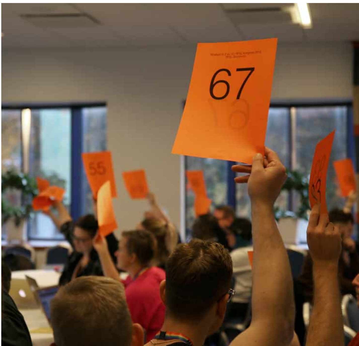
Kongressen 2019.