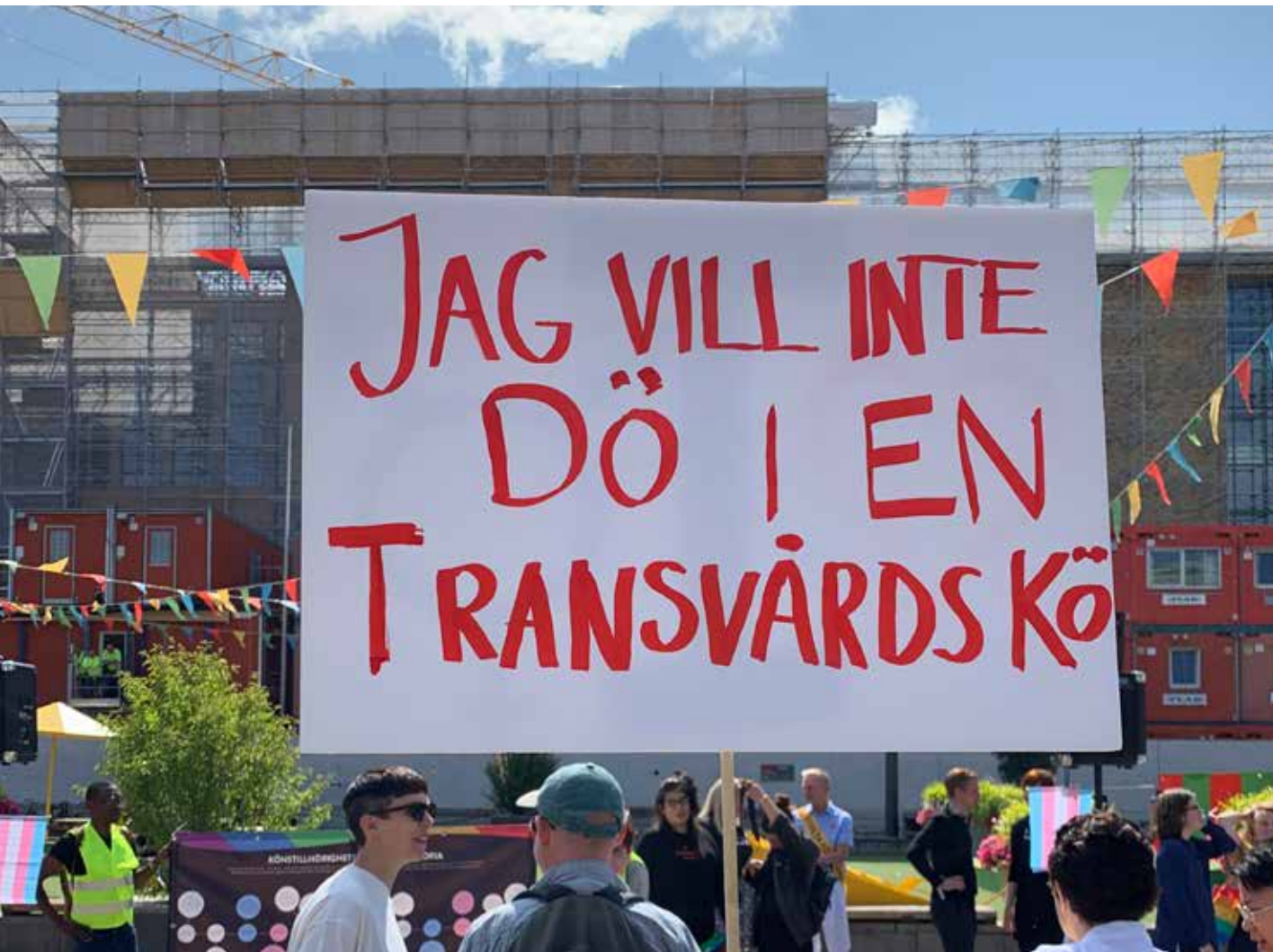
Under Stockholm Pride 2019 arrangerade RFSL och RFSL Ungdom en manifestation, på Medborgarplatsen, för införandet av en reformerad konststillbörighetslag.