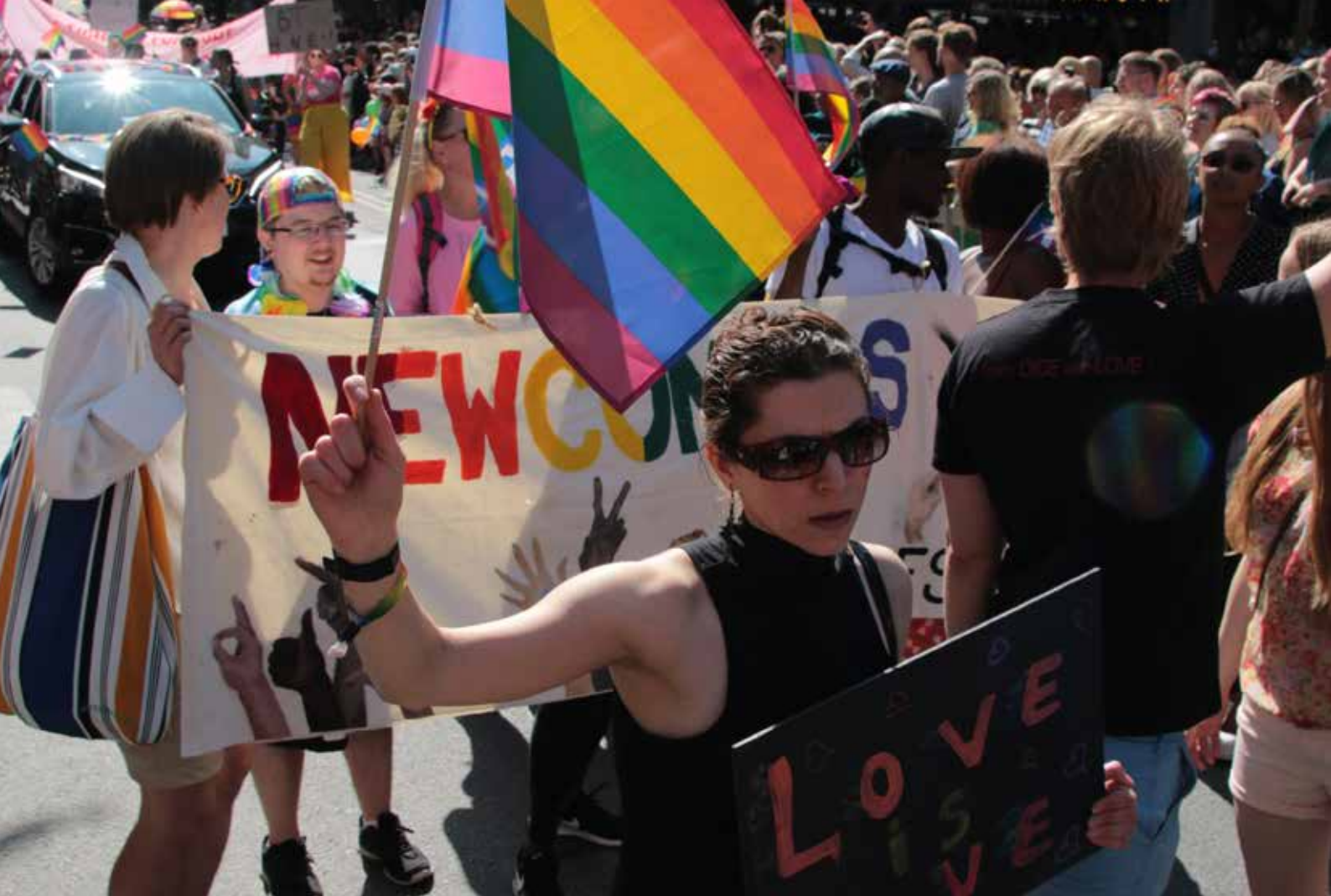
RFSL Newcomers i Stockholms Prideparad 2019.

lämnat över sina råd och rekommendationer till den parlamentariska kommitté som tillsatts för att utforma den framtida svenska migrationspolitiken.